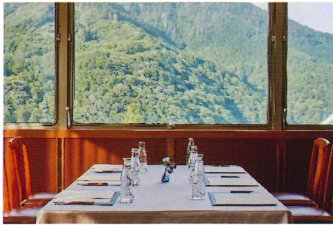
ヘンリーズ・ルーム(117㎡)