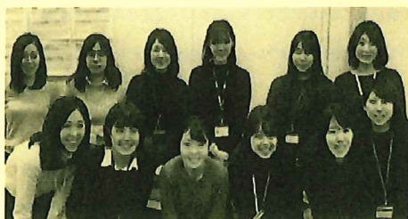
私たちがお伺いします！

更新のお手続き・ご説明については、今年も児童・生徒の夏期休業中期間に各学校の訪問を予定しております。 (訪問期間：8月6日(火)～9月6日(金) ※土日祝を除く)